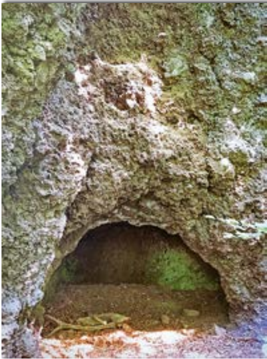
Abb. 5: Am Fuß der Falkenlay-Abbruchkante finden sich Höhlen. Sie werden Steinzeithöhlen genannt, jedoch fanden sich dort keine Artefakte aus der Steinzeit – wohl aber auf der Müllischwiese unweit der Höhlen.