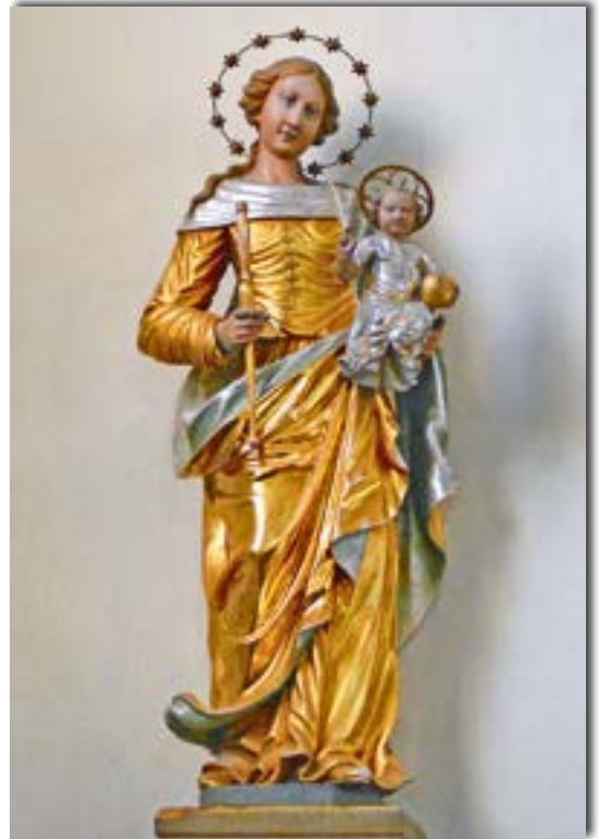
Abb. 6: Eine seltene Darstellung in der Kennfuser Kirche: die Muttergottes als Maria im Mieder.

Wir stehen hoch über dem Trichter des Hardtmaars, das direkt unter uns liegt. Von der Falkenlay stammt auch ein guter Teil der Steine, die für die Errichtung der Bruchsteinmauern mancher Kennfuser Häuser genutzt wurden. Wer mag, kann von hier einen Abstecher in das Dorf machen, dessen bedeutendstes Bauwerk die Filiationkirche St. Maria in der Moselblickstraße ist. Ihr Besuch lohnt sich wegen der seltenen Darstellung der Muttergottes im Mieder. Die Figur