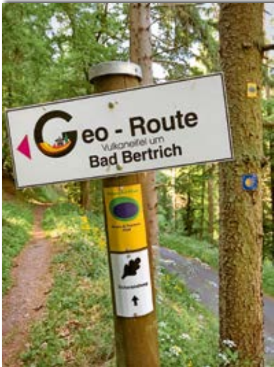
Abb. 2: Die Geo-Route verläuft teilweise auf denselben Trassen wie andere Wanderwege, hier dem Maare&Thermen-Pfad und dem Eichenblattweg, später auch dem Kurschatensteig.

Von einem Aussichtspunkt schauen wir auf die Elfenmühle, einer der früheren Bertricher Mühlen. Die Herkunft des Namens ist umstritten. Die These, dass es sich um die elfte Mühle am Ueßbach handelte, hält einer Zählung nicht stand; es gab viel mehr Mühlen an diesem Bachlauf. Vermutlich waren es doch die Zauberwesen der Elfen, die der Mühle und der dahinter liegenden Grotte ihren Namen gegeben haben. Die Elfengrotte ist ein bemerkenswertes Na-