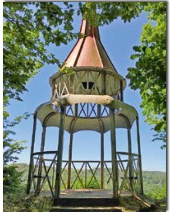
Abb. 10: Der Hohenzollernturm wurde zu Ehren Kaiser Wilhelms I. und dessen 100. Geburtstag gebaut.

wachsen dort wieder Douglasien, Ebereschen, Ahorn und Kirschbäume. Der Weg mündet in einen Platz mit dem schönen Namen „Oase der Ruhe“, von wo aus sich ein fantastischer Panoramablick über Bad Bertrich bietet. Die Ortsgruppe Bad Bertrich des Eifelvereins hat hier 1997 die Schutzhütte „Eifelhütte“ errichtet. Nachdem wir uns an Bad Bertrich sattgesehen haben, setzen wir den Weg durch den Wald in Richtung Hohenzollernturm fort, von wo aus sich ein weiterer großartiger Ausblick bietet, diesmal über das Bertricher Tal in seiner gesamten Längsausdehnung von Ost nach West. (Abb. 9)