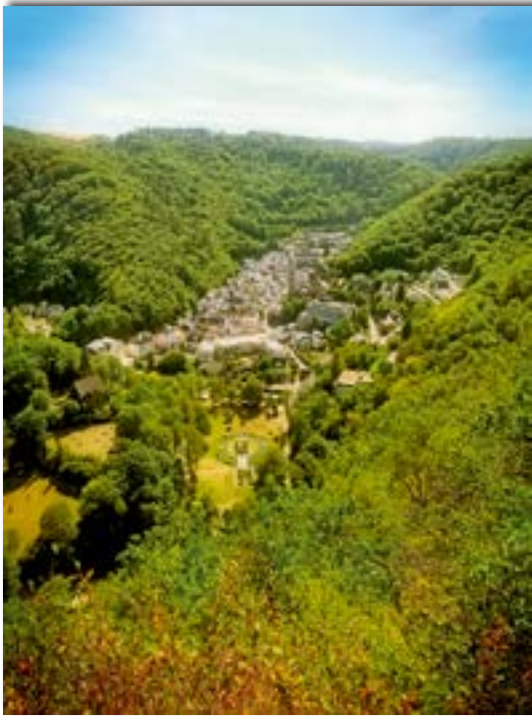
Abb. 9: Blick vom Hohenzollernturm über das Bertricher Tal nach Westen