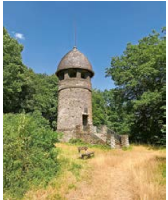
Abb. 11: Den Bismarckturm von 1908 finanzierten Bertricher Kurgäste, indem sie fleißig spendeten.

Der Hohenzollernturm mit seinem charakteristischen roten spitzen Helm entstand auf Anregung des Bertricher Verschönerungsvereins 1896/97 durch Spendenmittel zum 100. Geburtstag Kaiser Wilhelms I. und zu Ehren der Familie des Kaisers. (Abb. 10) Er ist bis heute ein beliebtes Ausflugsziel. Gleiches gilt für den etwa zehn Gehminuten vom Hohenzollernturm entfernten Bismarckturm, der aber von hier aus nicht sichtbar ist. Bei ihm handelt es sich um einen Bruchsteinrundbau mit Steinhelm aus dem Jahr 1908, finanziert ebenfalls aus Spenden von Kurgästen. (Abb. 11)