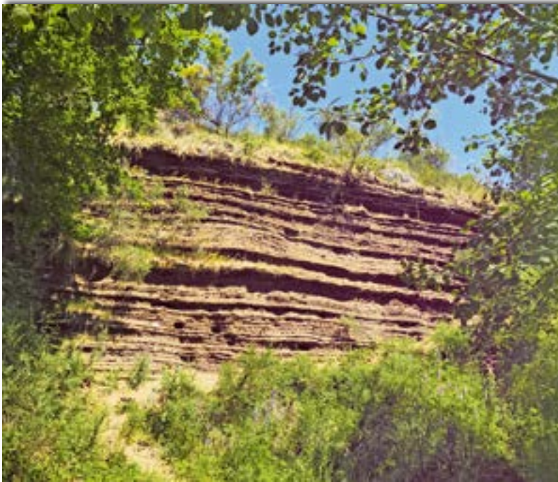
Abb.: 7: Die Sedimentwand Lavakaul am Rande eines bis 1975 betriebenen Tuffsteinbruchs

abgebaut. Ein frei gehaltener Aufschluss lädt dazu ein, die vulkanischen Ablagerungen zu studieren, die aus Maartephra des Hardtmaars besteht. (Abb. 7) Folgen wir dem „G“ der Geo-Route, so gelangen wir durch einen Waldweg zu einem aufgelassenen Schlackensteinbruch, in dem sich eine Felswand aus Schlacke präsentiert: rote, lockere Lavaschichten unten sowie massive graue im oberen Bereich.