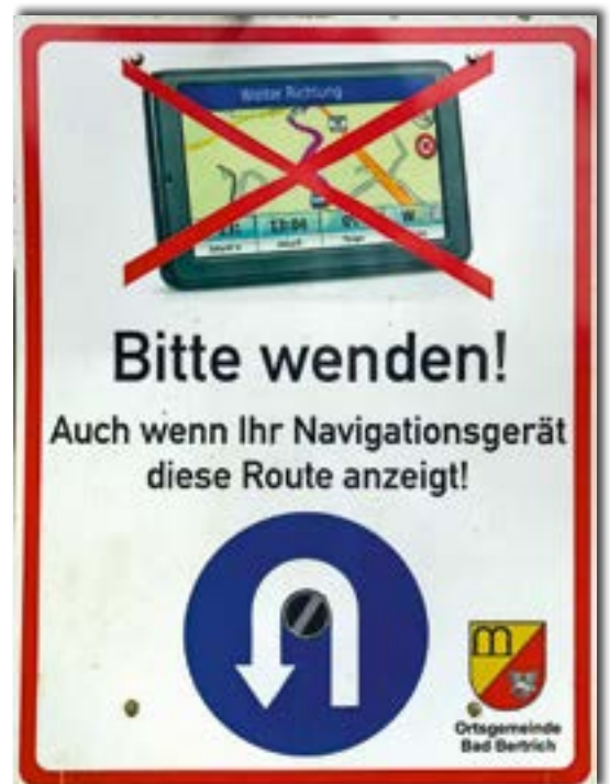
Abb. 8: Das vielleicht kurioseste Verkehrsschild Deutschlands. Wer es missachtet, bekommt auf den Nadelöhr-Serpentinen hinunter nach Bad Bertrich Schwierigkeiten.

Wir wenden uns an dieser Stelle nach links, verlassen nun die Geo-Route und durchqueren eine Aufrostungsfläche, auf der im Januar 2007 der Orkan Kyrill fast vier Hektar Wald umgeworfen hatte. Heute