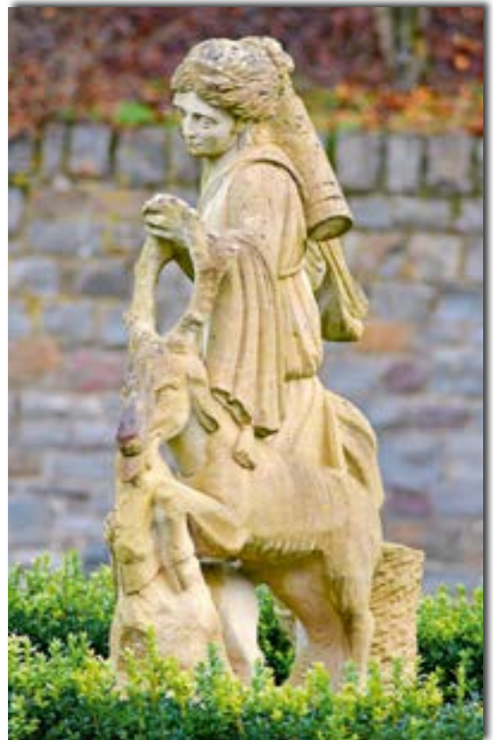
Abb. 1: Die Diana-Statue ist eine veränderte Replik der 1858 in Bad Bertrich gefundenen Darstellung der römischen Jagdgöttin.

Die Geo-Route beginnt direkt an dem Verkehrskreisel. Ein „G“ weist uns den Weg. (Abb. 2) Sie steigt zunächst recht steil an, wobei der Pfad schon bald den Charakter eines alpinen Steigs annimmt und immer wieder herrliche Blicke ins Ueßbachtal bietet.