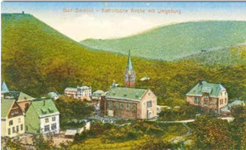
Abb. 12: Die katholische Kirche Bad Bertrich auf einer historischen Postkarte um 1900. Das Kirchschiff ist hier noch nicht erweitert worden. Rechts das Pfarrhaus.