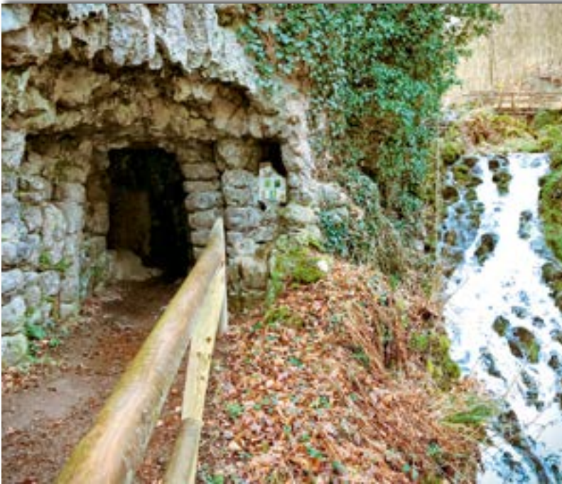
Abb. 3: Die Elfengrotte an der Mündung des Elbesbaches in den Ueßbach wird auch Käsegrotte genannt. Der erstarrte Basaltstein erinnert an aufgestapelte Käselaibe. Früher wurde die Grotte als Kühlschranks genutzt.